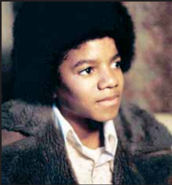
1973. Allerede som 6-årig kom Michael Jackson med i sine ældre brødres band, Jackson Brothers, der var meget populære i 60'erne og 70'erne.