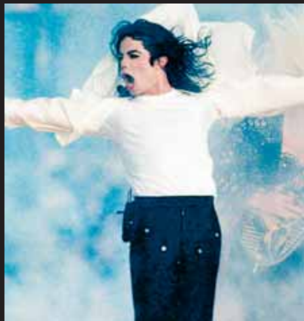
1993. En Michael Jackson-koncert er også et danseshow med Jackson selv i front. Her under en kortvarig gæstetoptræden ved Super Bowl i Californien.