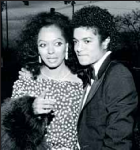
1981. Til Oscar-uddeling med en af sine modne veninder, sangerinden Diana Ross.