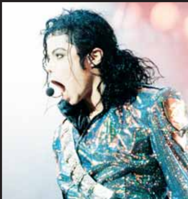
1992. Michael Jackson besøgte Danmark tre gange. Første gang var på Gentofte Stadion, hvor dette foto er taget.