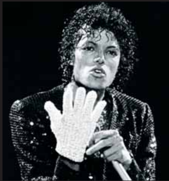
1984. Den paillet-besatte handske er på plads, da Michael Jackson indleder turne på Dodger Stadium i Los Angeles.