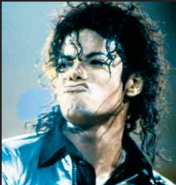
1988. 80'erne var det store årti for The King of Pop, han udgav nogle af sine hovedværker og turnerede verden rundt. Her er vi i Hamburg.